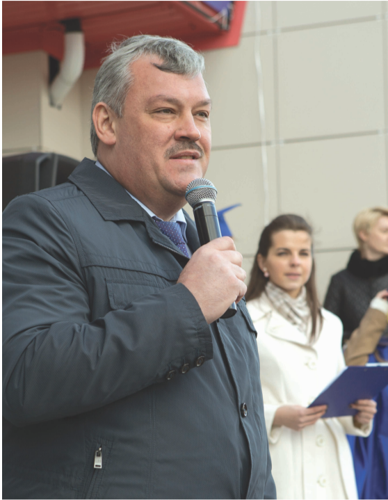
Торжественное открытие бизнес-инкубатора УГТУ при участии врио Главы РК С.А. Гапликова