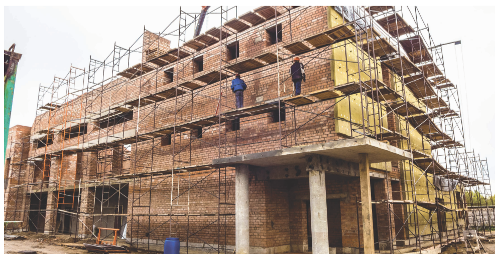
Строительство плавательного бассейна