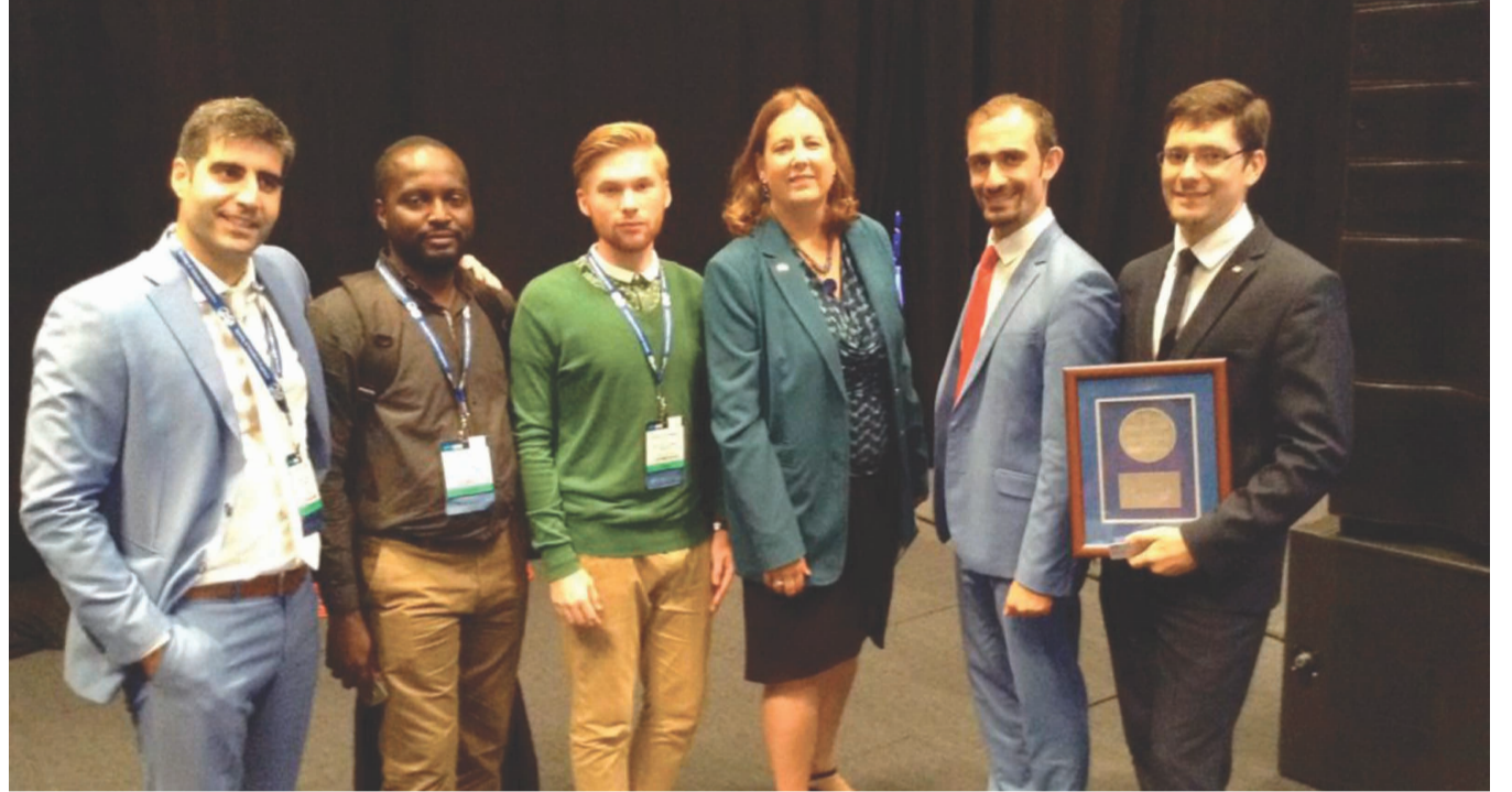
Наша профессиональная секция Общества инженеров-нефтяников (SPE) Timan-Pechora Section третий год подряд была отмечена президентской наградой на международном форуме SPE