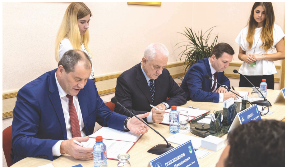
Форум «Развитие системы профессионального образования в Республике Коми».