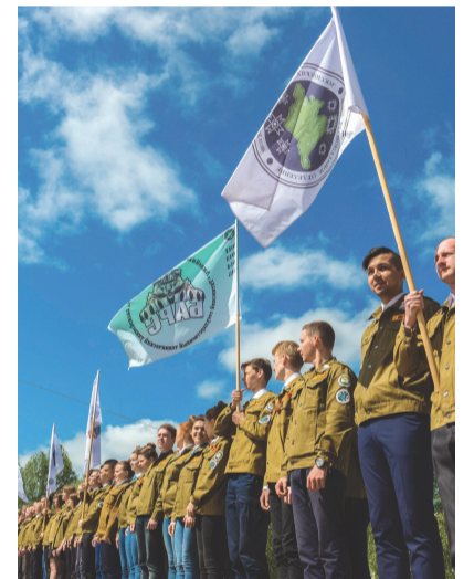
Коми региональное отделение «Российских Студенческих Отрядов» по результатам всероссийского рейтинга вошло в двадцатку лучших региональных отделений России и уже второй год подряд становится лучшим региональным штабом Северо-Западного федерального округа.