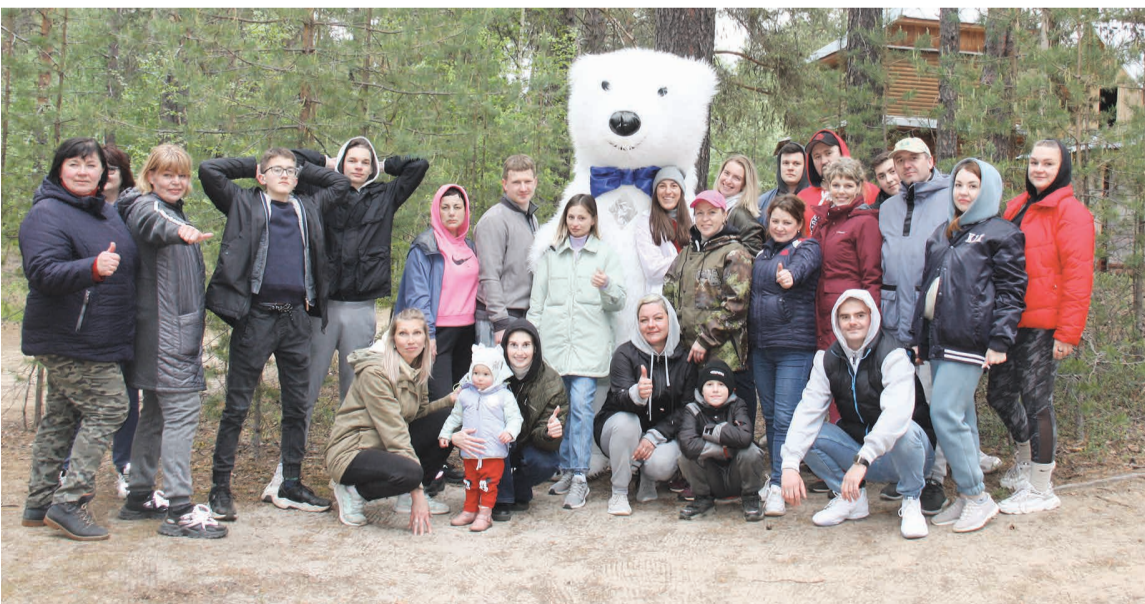
Подарком сотрудникам вуза и детям был визит огромного веселого Мишки!