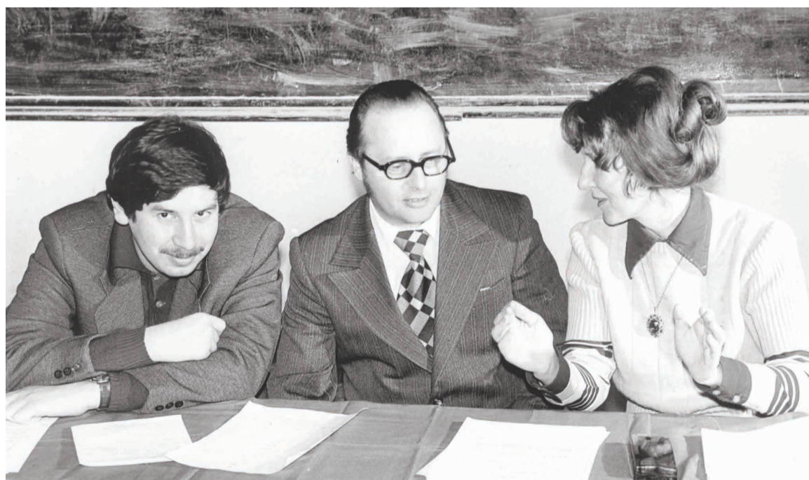
Жюри олимпиады. 1976 г.