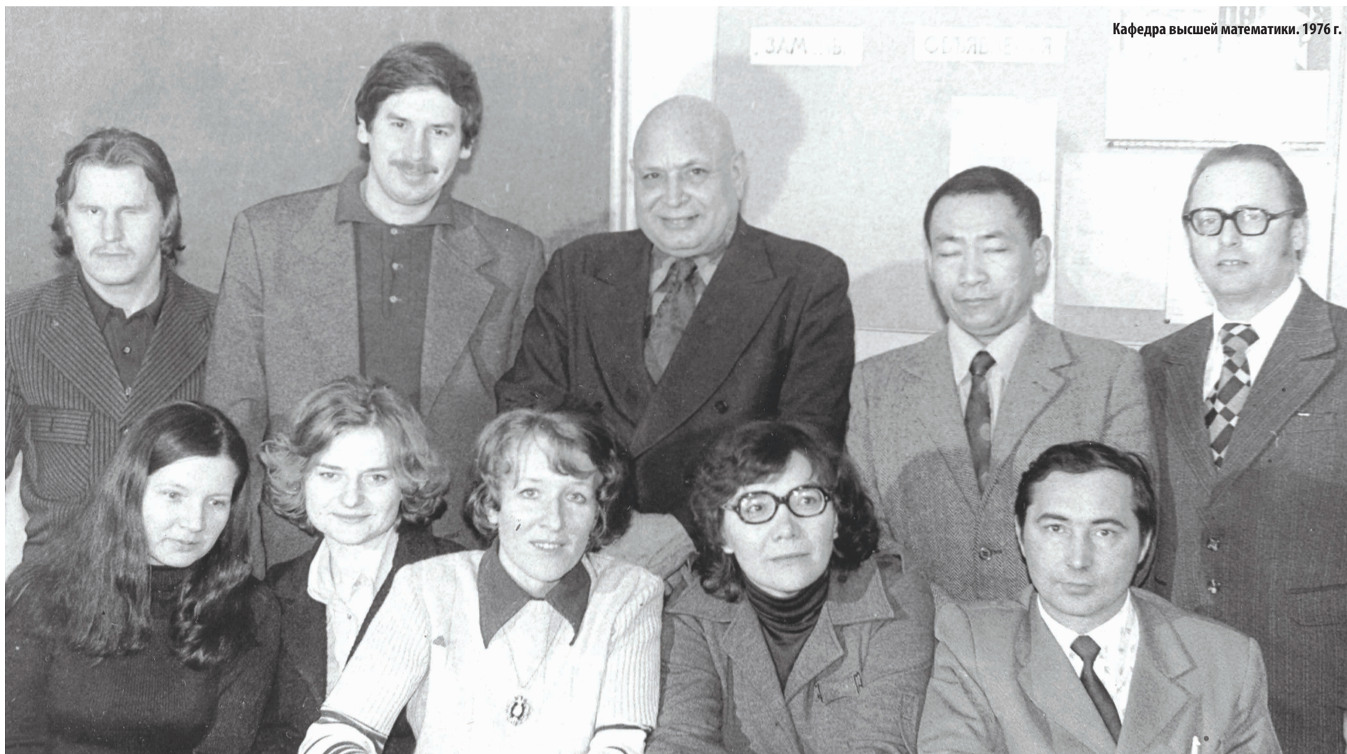
Кафедра высшей математики. 1976 г.