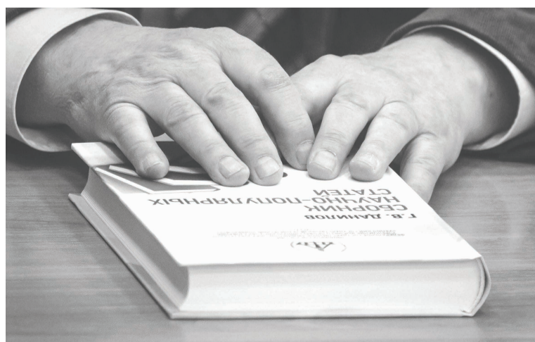
Презентация «Сборника научно- популярных статей», 2016 г.