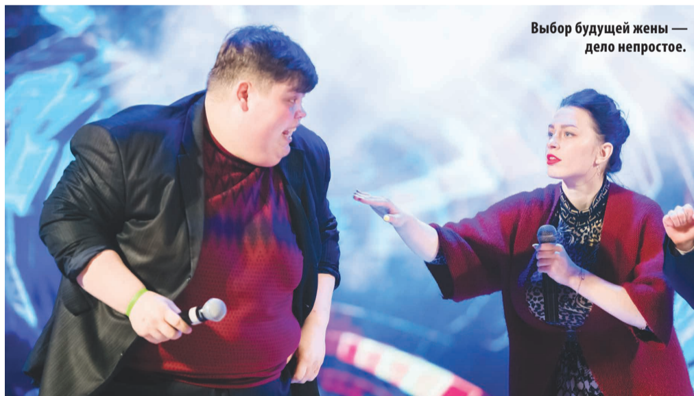
Выбор будущей жены — дело непростое.