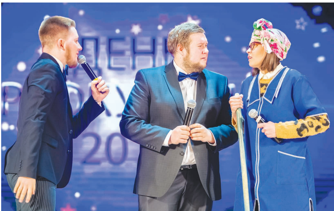
Хотя ведущие и супермены, но против уборщицы не погрешь.