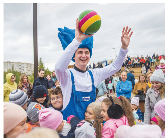
Открытие набережной Газовиков в Ухте.