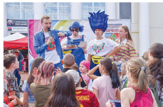
«Территория дружбы» в Печоре.