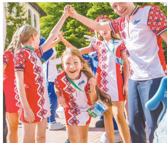
«Территория дружбы» на фестивале «Факел» в Сочи.