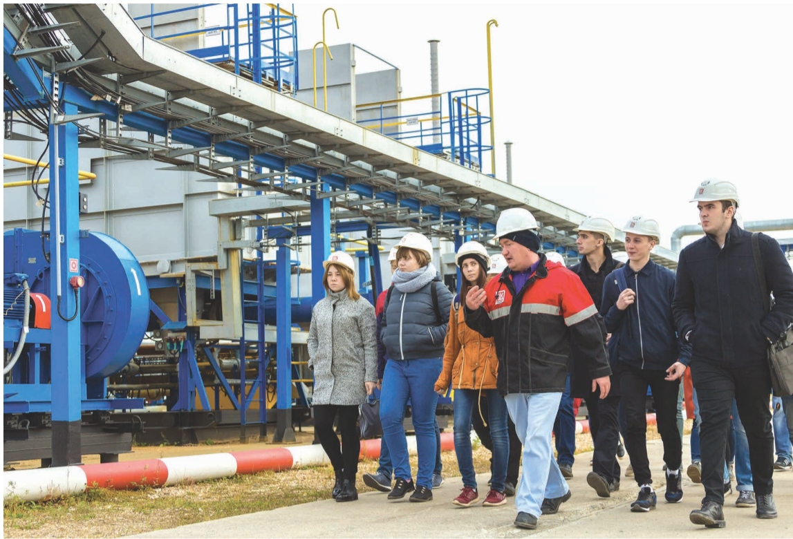
Экскурсия на Западно-Тэбукское месторождение, Нижний Одес.

научно-техническую разработку 2016 года в структурных подразделениях Общества.