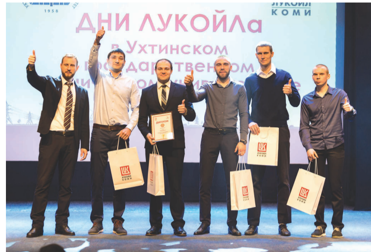
На праздничном концерте в честь Дней ЛУКОЙЛа состоялось награждение активных студентов и участников мероприятий.

Университет благодарит руководство ООО «ЛУКОЙЛ-Коми» за высокую результативность и многогранность многолетнего сотрудничества и выражает уверенность в том, что совместные образовательные и научные проекты будут и далее реализовываться на благо развития компании «ЛУКОЙЛ» и нефтяной отрасли страны.