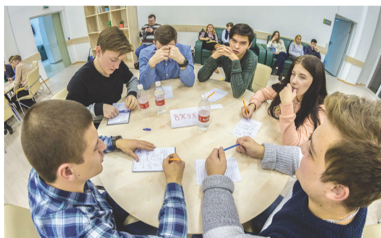
Третий чемпионат студенческой интеллектуальной игры «Что? Где? Когда?».