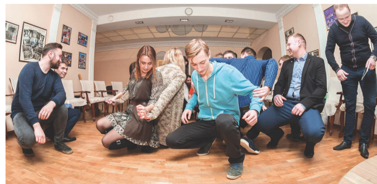
Участники командообразующего тренинга переходят с одной стороны зала на другую, применяя разнообразные способы передвижения, кроме стандартных.