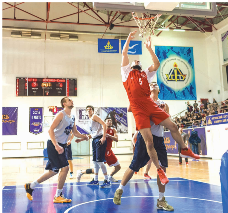
Товарищеский матч по баскетболу между студентами УГТУ и молодыми специалистами «ЛУКОЙЛ-Коми».