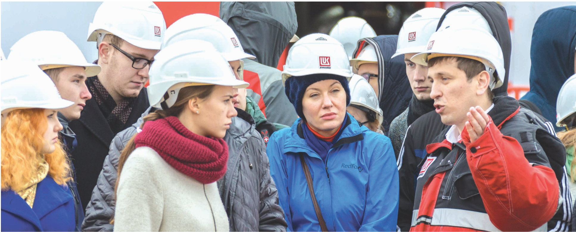
Экскурсия на объекте НШУ «Яреганефть».