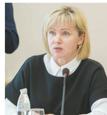
Наталья Якимова, министр образования, науки и молодёжной политики РК.