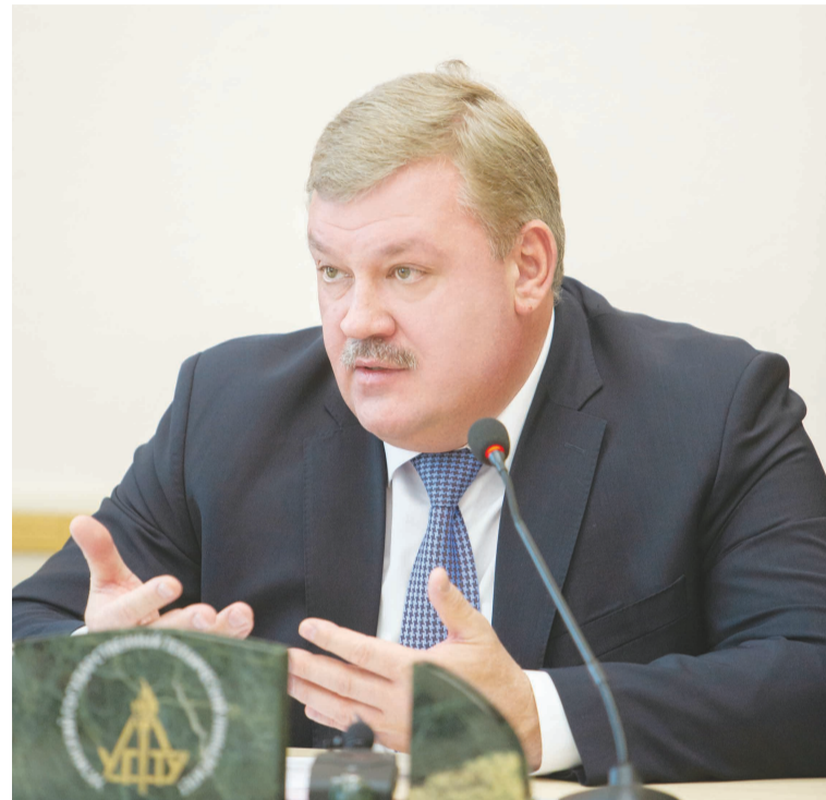
Сергей Гапликов, Глава Республики Коми.