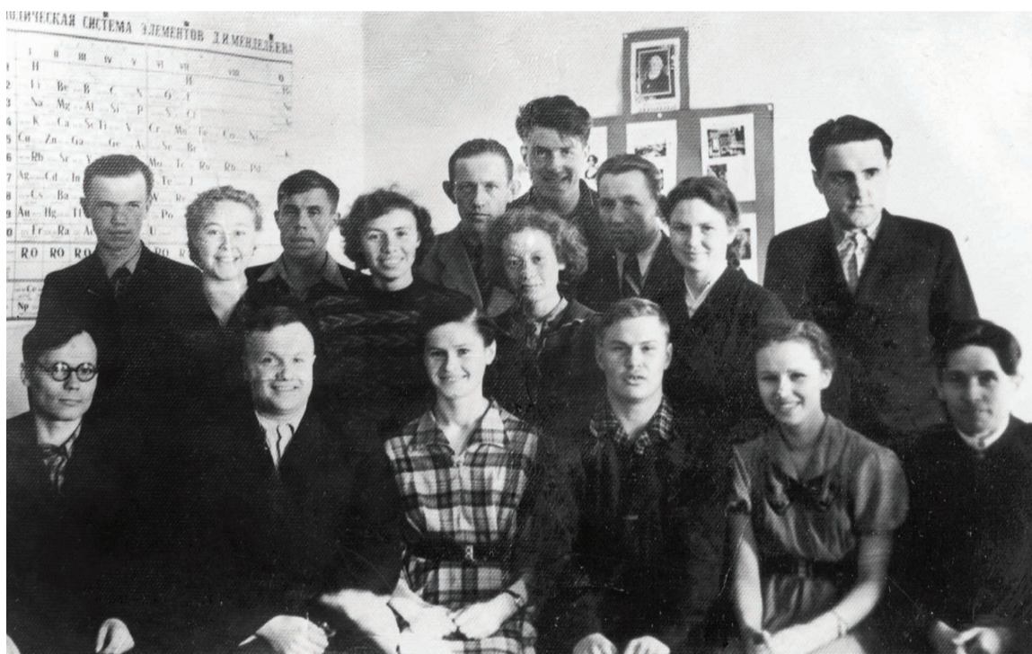
Студенты вечернего общетехнического факультета МИНХИГП. 1965 г.