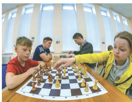
Открытие городского турнира началось с танцевальной композиции учеников «Ростка» «Шахматный поединок».