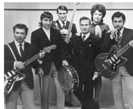
Выступление на Ухтинском телевидении вокально-инструментального ансамбля, 1970 г.

Все внутренние фестивали, концерты и конкурсы всегда привлекали внимание широкой городской общественности, редко обходились без гостей из других городов республики. Большая часть досуговых мероприятий по своему значению и масштабу выходила за рамки института, а иногда и города.