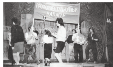
Сцена из спектакля «Приключения Бори Тинина». 1986 г. Режиссеры: преподаватели кафедры гидравлики Г.И. Санина, Л.Н. Раинкина.