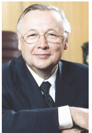
Айрат Мингазович ШАММАЗОВ , ректор Уфимского государственного нефтяного технического университета с 1994 по 2014 гг.