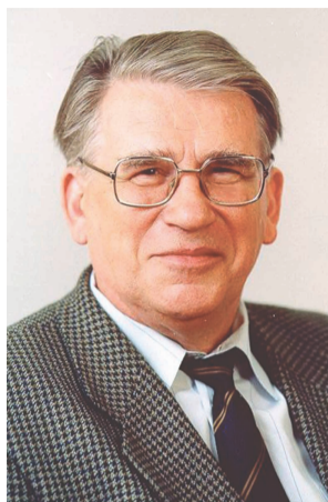
Альберт Ильич ВЛАДИМИРОВ , ректор Российского государственного университета нефти и газа имени И.М. Губкина с 1993 по 2008 гг.