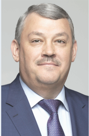
Сергей Анатольевич ГАПЛИКОВ, глава Республики Коми