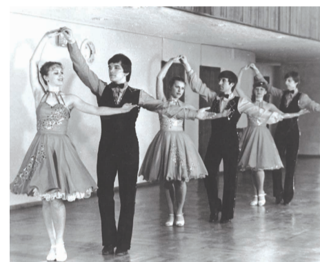
Танец «Сударушка» в исполнении ансамбля «Нежность».