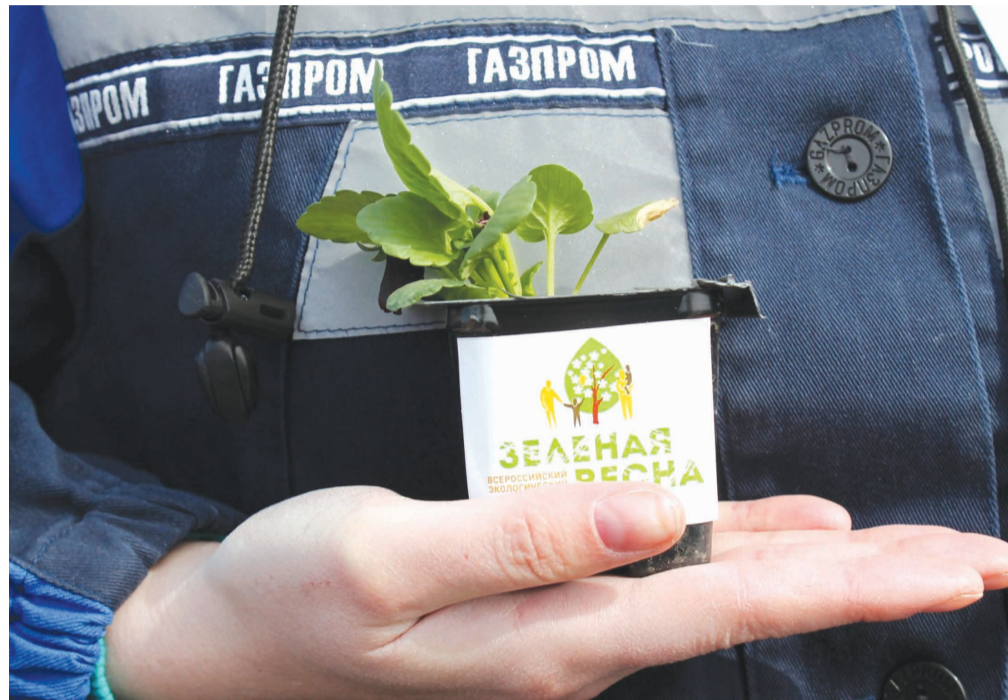
Фотографии ООО «Газпром трансгаз Ухта»

Работники ООО «Газпром трансгаз Ухта» ежегодно принимают участие в акции «Зеленая весна». Мероприятия направлены на ликвидацию несанкционированных свалок, расчистку захламленных территорий, вывоз мусора, раздельный сбор и передачу отходов на утилизацию, благоустройство территорий, посадку деревьев. Проект позволяет поддерживать экологическую инициативу сотрудников предприятия и сформировать бережное отношение к окружающей среде.