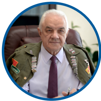
Дорогие мои бойцы!

Вот и снова весна – уже не формально-календарная, а настоящая, с проталинами, плюсовой температурой и небом ярко-голубого цвета. Вот и снова штаб КРО РСО (где, впрочем, никогда не бывает слишком спокойно) превращается в самое шумное, подвижное, многоголосое места университета. Так и должно быть – ведь уже совсем немного осталось до начала летнего трудового семестра. К нему надо подготовиться – чтобы долгожданная «целина» на вызвала у бойцов разочарования, чтобы время работы в студенческом отряде вспоминалось в числе лучших периодов жизни.